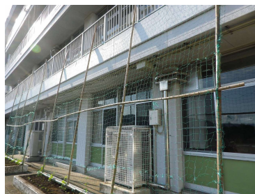
キャロットクラブの皆さまによる七夕飾りとグリーンカーテン