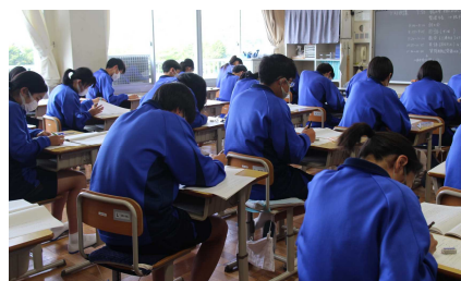
4/18 全国学力学習状況調査(3年)