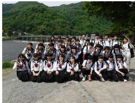
学級別研修（2組：嵐山渡月橋）