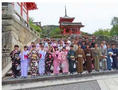
学級別研修（1組：和服体験）