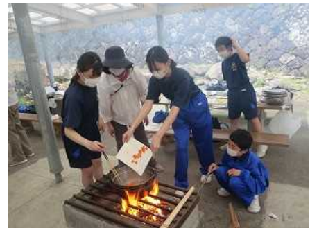
キャロットクラブさんとカレー作り

17日（火）は、講師をお招きして、認知症や手話、盲導犬などの福祉学習を行いました。18日（水）は、ジオリアや時代劇場ドラマ館の見学、桃沢野外活動センターでのカレー作り、キャンプファイヤー等の活動を行いました。19日（木）は、滑沢渓谷などジオサイトを見学しました。事前の話合い活動や当日の活動を通して、中学校入学後の新しい仲間との絆を深め、よりよい人間関係を築くことができました。また、カレー作りとキャンプファイヤーでは、キャロットクラブの皆様から多大なご支援をいただき、生徒たちは安全で楽しく活動を行うことができました。ありがとうございました。