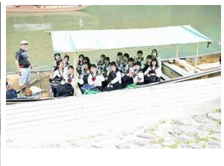
学級別研修（3組：保津川下り）