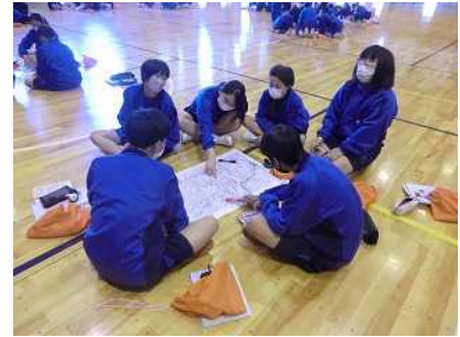
災害発生時の図上訓練

2年生は、5月17日（火）から19日（木）の3日間、日本赤十字社奉仕団や、国土交通省沼津河川事務所、静岡地方気象台、県東部地域局危機管理課など、関係諸機関のご協力をいただき、校内で防災に関する学習を行いました。1日目は炊き出し訓練や避難所運営訓練、2日目はふじのくにジュニア防災士取得のための講義や実習、3日目は学習のまとめを行いました。次代の担い手となる子供たちへの防災啓発、次世代の防災リーダー育成の機会となりました。