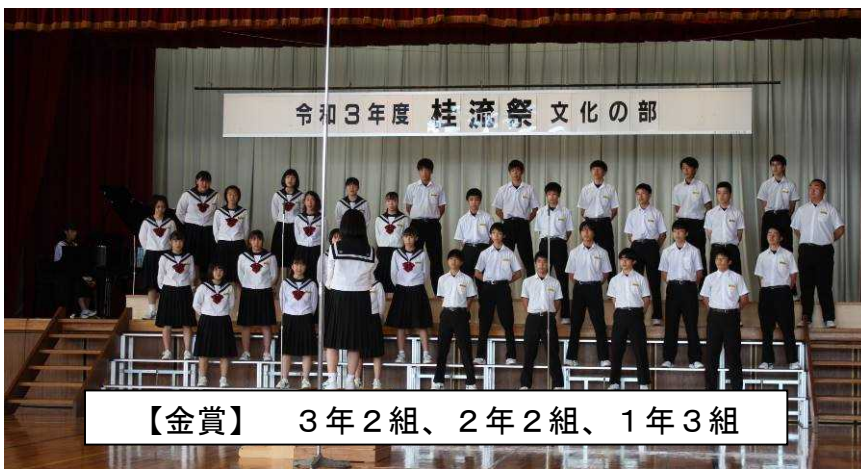
【金賞】 3年2組、2年2組、1年3組