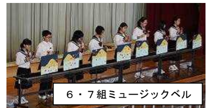
6・7組ミュージックベル