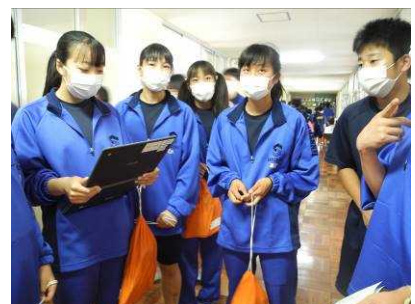
6/2「修中王」（生徒会企画）

更にどのような取組ができるのか、授業または授業以外の場面でどのような活用ができるのか、生徒と同様に職員も「挑戦」していきたいと思えます。