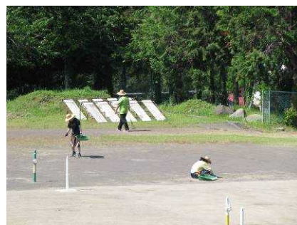
職員による奉仕作業