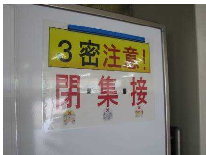
掲示物による呼び掛け