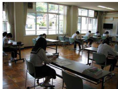
3密を避けた学習（登校日）

保護者、地域の皆様には、ご迷惑やご心配をお掛けしておりますが、学校再開に向けて準備を進めてきましたので、今後も変わらぬご支援・ご協力をいただけますよう、よろしくお願い申し上げます。