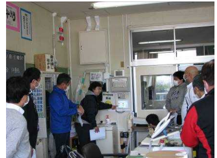
熱中症システムの説明会

昨年度、空調機が整備され、快適な状態で授業を進めることができました。しかし、環境数値がどのように推移しているか、感覚に個人差がある等の課題がありました。そこで教室、体育館、運動場にセンサーを設置することで、熱中症指数(WBGT指数)を遠隔計測・記録し、空調機を制御するシステムが、モニターとして本校と南小の2校に導入されました。今後は、熱中症指数が危険値に達すると、職員室のパトライトで警告し、空調運転が自動で行われることとなります(手動による操作も可能です)。これは、全国に先駆けての取組となります。臨時休業期間中、機器の設定や操作に関する説明会が開かれました。